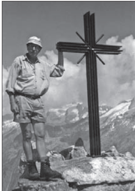
Sidelhornkreuz op +2.763m

zo vaak – ook hier zit het venijn in de staart, in de vorm van een beproefd keienspoor. Het gaat stap voor stap en al zigzaggend, moeizaam van steen naar steen, soms zelfs met handen en voeten.