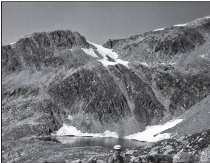
Boven: de Grimselseelücke op +1.909 m