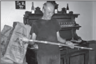
Bedevaart in Frankrijk (1)