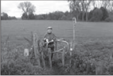
Terugblikken op de Jubileumtocht

CLUBBLAD VAN WSV OLAT • JAARGANG 33 • NUMMER 12 • DECEMBER 2007